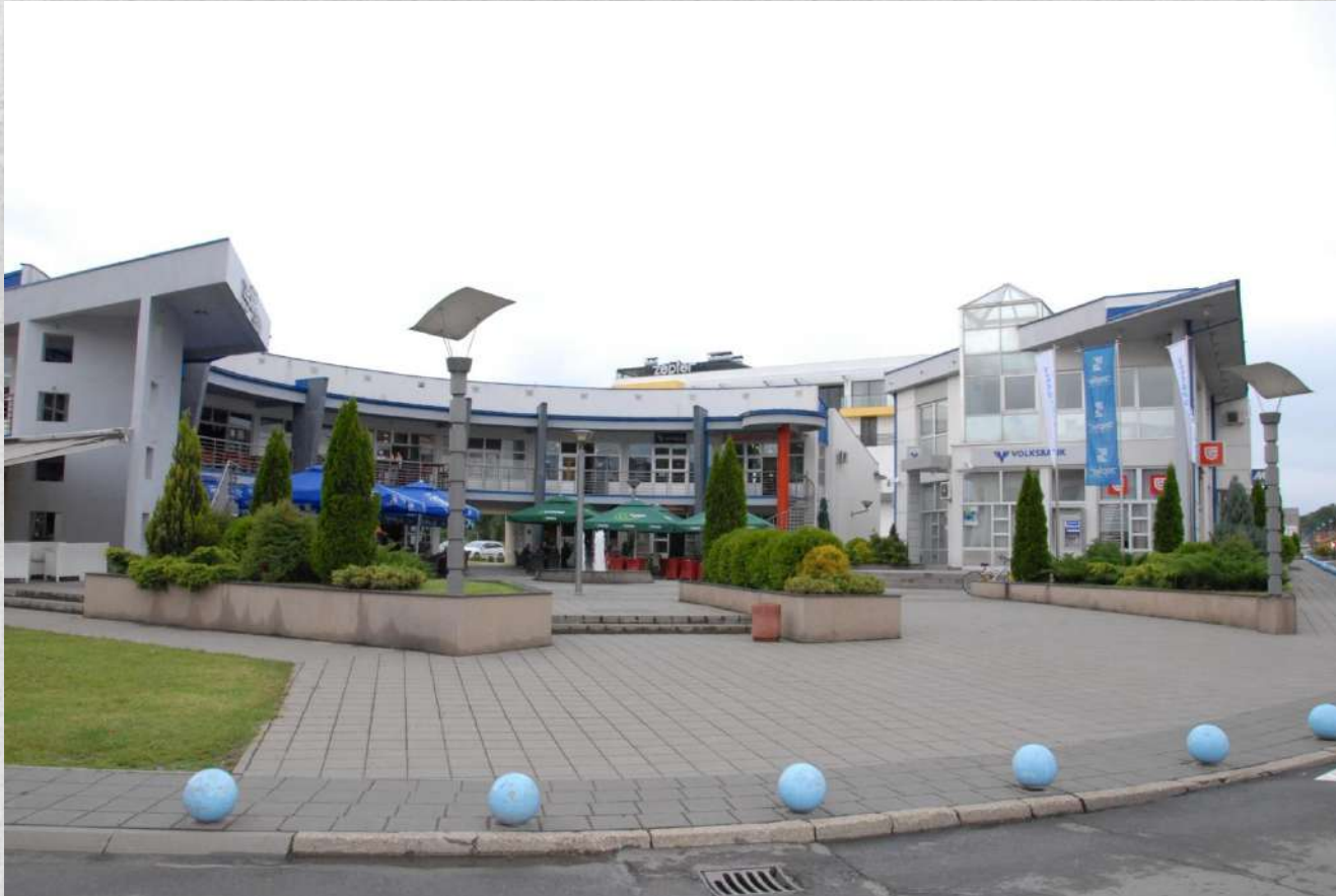
Centro commerciale “Zepter plato”