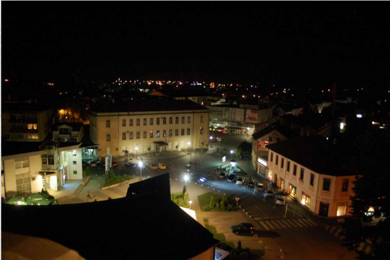
Centro di Kozarske Dubice

POSIZIONE - VANTAGGI - POTENZIALE – AFFIDABILITA' – ATTRATIVITA'