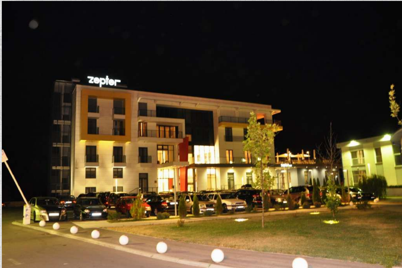
“Zepter Hotel” – di notte

POSIZIONE - VANTAGGI - POTENZIALE – AFFIDABILITA’ – ATTRATTIVITA’