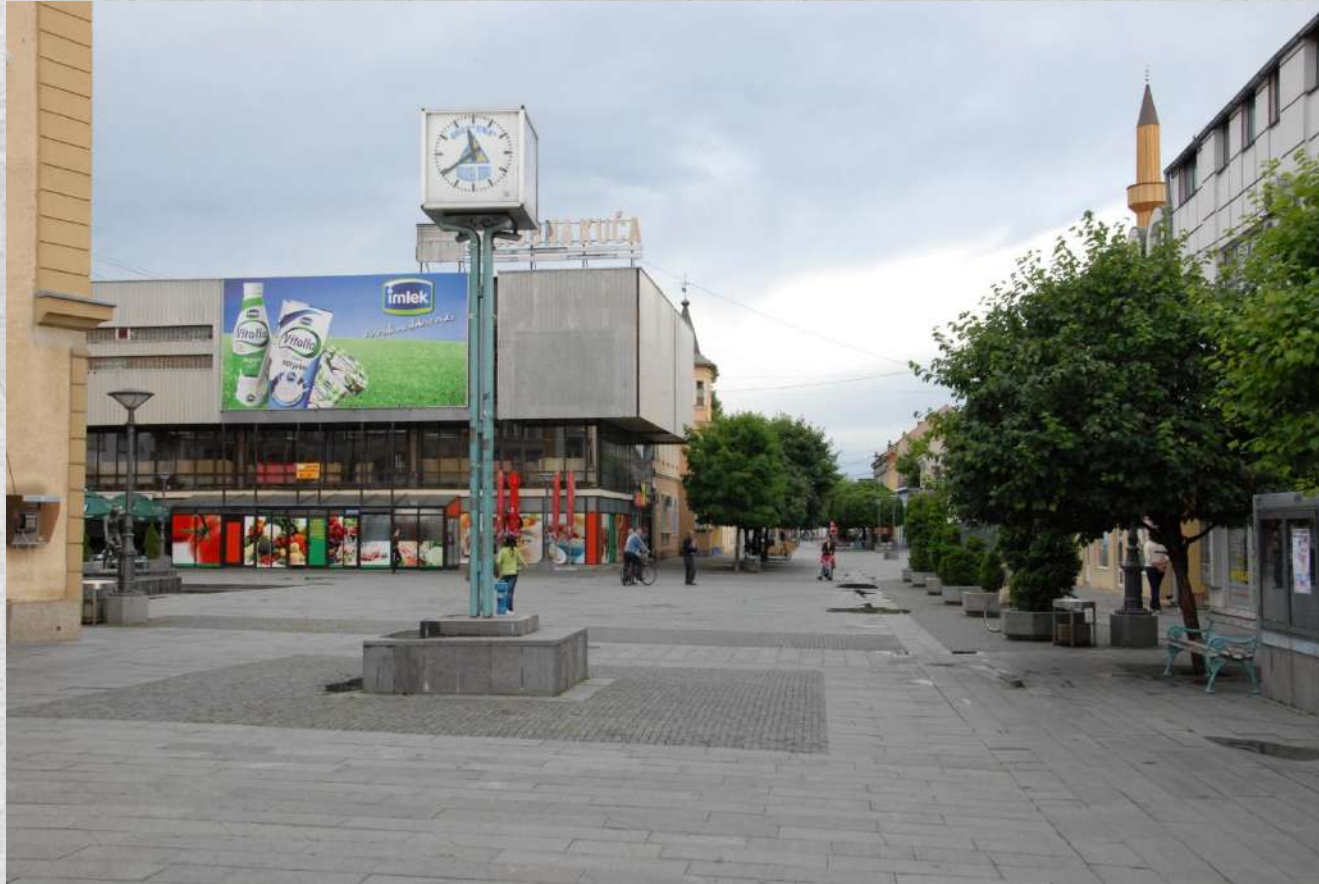
Vista area pedonale