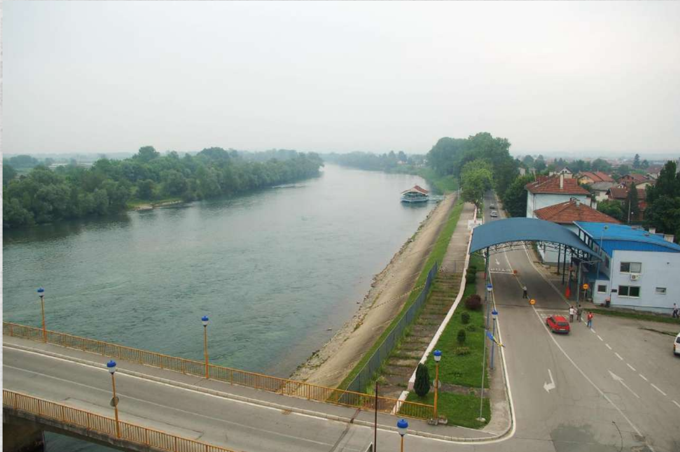
Vista fiume Una e la dogana