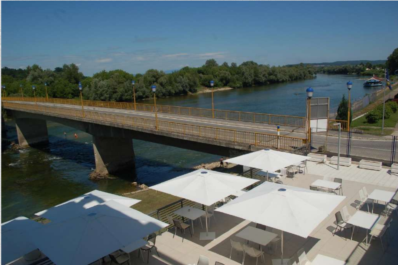
Fiume Una - ponte, dogana